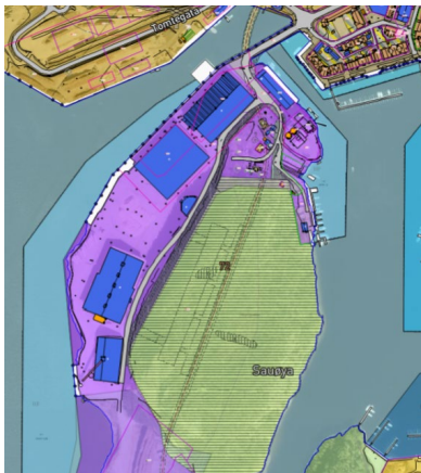
Utsnitt av gjeldende regulering over, kommuneplan i fig. under.

Området er i hovedsak regulert til friluftsområde (med anlegg i fjell under), men omfatter noe industriformål i nord. I kommuneplanen er tilsvarende områder avsatt til henholdsvis LNF-formål og næringsformål.