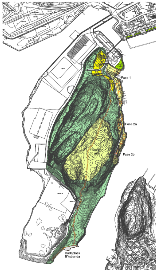
Kartskisse – innspillsområder markert med gul farge. Forslag om gangbru i nord er ikke konsekvensutredet som en del av innspillet.