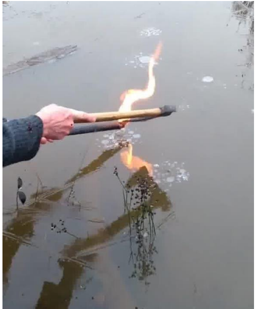
Det bobler i grunnen og gassen brenner på Tyska og Hollenderen Egne foto fra filmopptak 28. november 2020