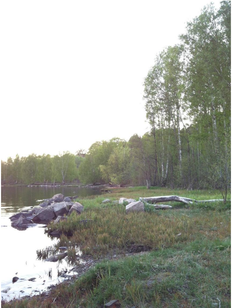
Strandbeltet og skogen bak, sett fra Tyska mot vest 11. mai 2016