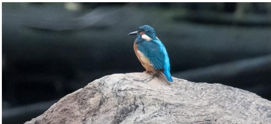
Isfugl på sten ved Tyska i Halden 21. oktober 2017