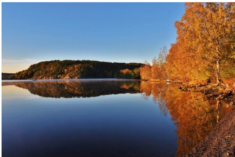
Høst på Tyska og Hollenderen oktober 2020

Stans utbygging av Tyska og Hollenderen samarbeider med lokale foreninger og lag, lokale velforeninger og borettslag.